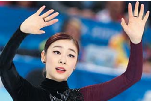
Kim Yuna 김연아

2014 소치 동계올림픽에서 구겐하임 협회 Kwame Dawes라는 시인이 각 날짜마다 시를 썼다. 폐회식날에는 안타깝게 은메달을 수상한 김연아에 대한 시를 썼는데 내용이 아름답다. Closing Ceremony, Kim Yuna Unceremonious Silver(격식없는 은메달)이란 제목의 올림픽시다.